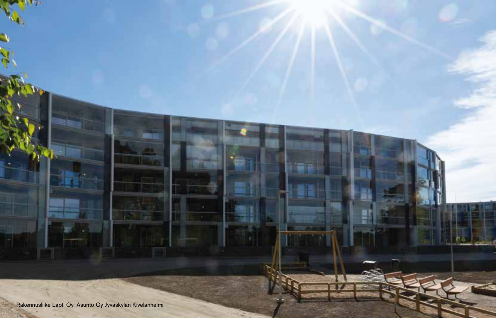
Rakennusliike Lapti Oy, Asunto Oy Jyväskylän Kivelänhelmi